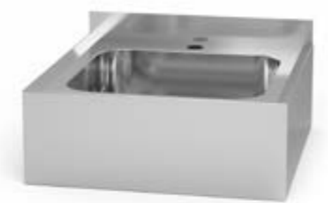
2 Umywalka z przetłoczeniem