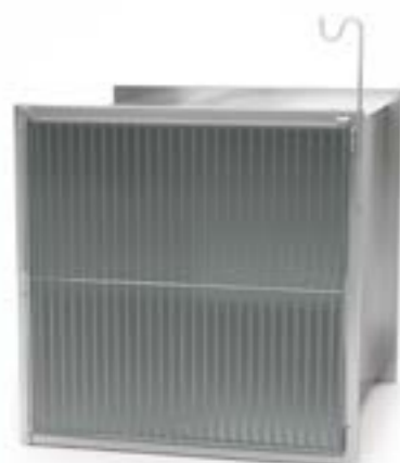
3 Klatka pojedyncza tlenowa