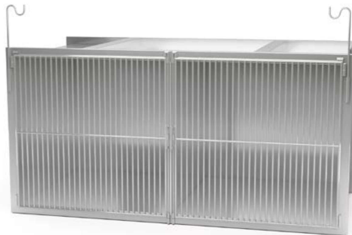
1 Klatka podwójna bez kuwety