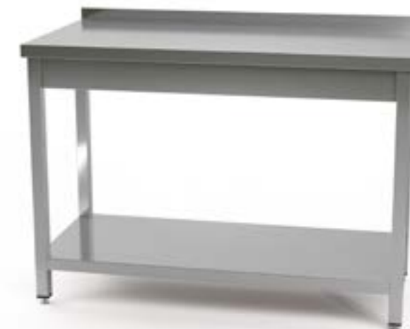
1 Stół przyścienny z półką