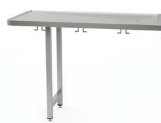
2 Stół montowany do ściany podnoszony z blatem profilowanym z odpływem