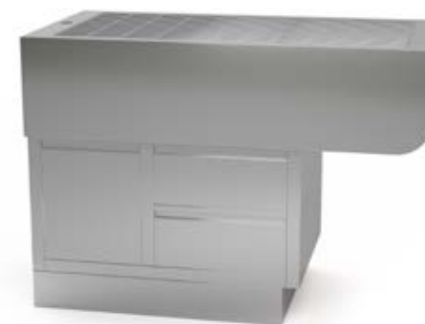
2 Wanna centralna na szafce okrągła