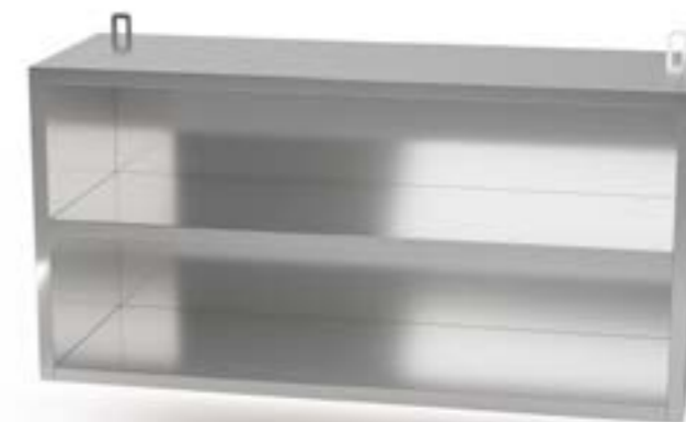
1 Szafka wisząca otwarta