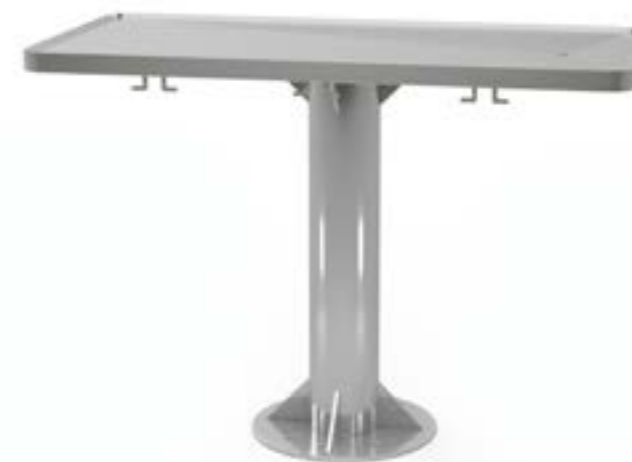
2 Stół centralny na okrągłej nodze z uchwytami z blatem profilowanym z odpływem