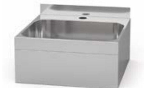
1 Umywalka bez przetłoczenia