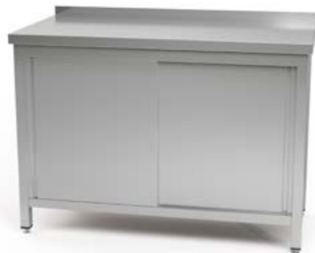
2 Stół przyścienny z szafką z drzwiami suwanymi