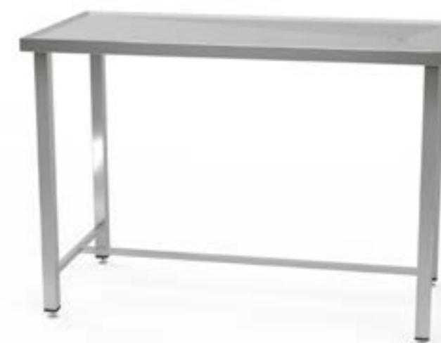
2 Stół centralny z blatem profilowanym z odpływem