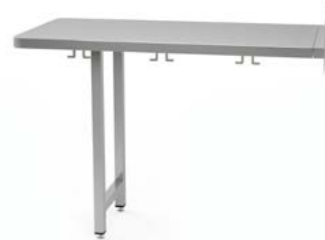
1 Stół montowany do ściany podnoszony z blatem prostym