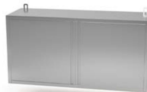
2 Szafka wisząca z drzwiami uchylnymi