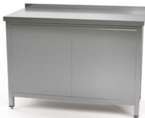
1 Stół przyścienny z szafką z drzwiami uchylnymi