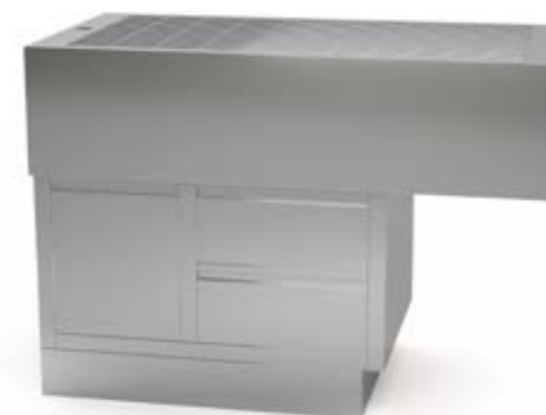
1 Wanna centralna na szafce kwadratowa