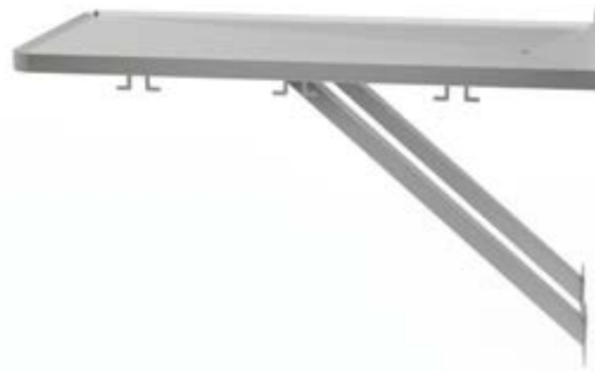
2 Stół montowany do ściany stały z blatem profilowanym z odpływem