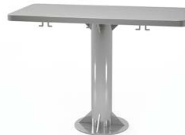
1 Stół centralny na okrągłej nodze z uchwytami z blatem prostym