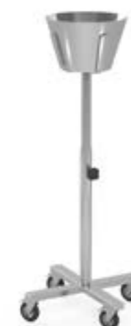
4 Stojak na miskę jezdny