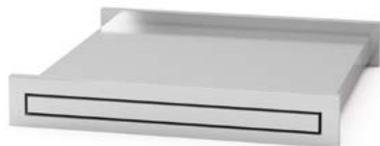
5 Błat wysuwany