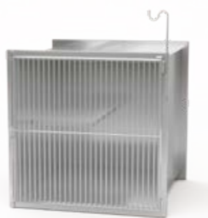
9 Klatka pojedyncza z półką, dla kota