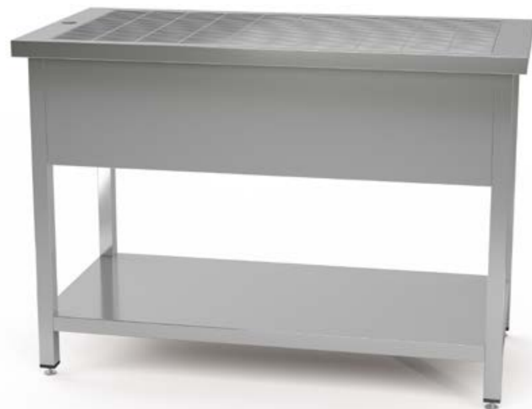
1 Wanna centralna otwarta