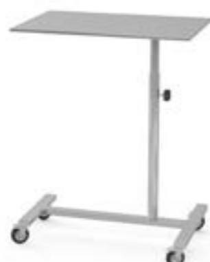
5 Stolik narzędziowy M z kółkami