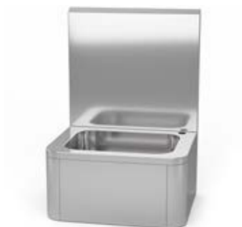
3 Umywalka kolanowa z baterią