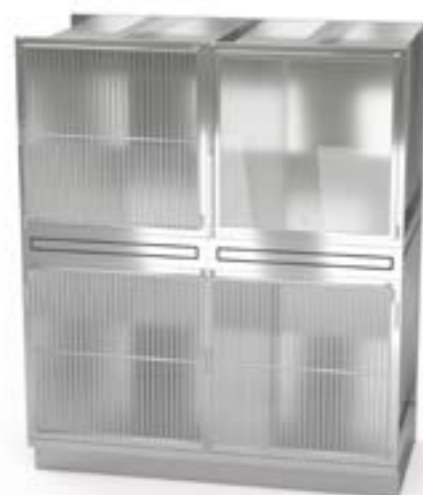
2 Blat wysuwany