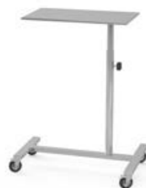
4 Stolik narzędziowy S z kółkami