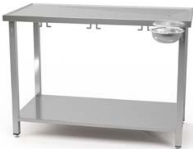
2 Stół centralny z półką i uchwytami z blatem profilowanym z odpływem