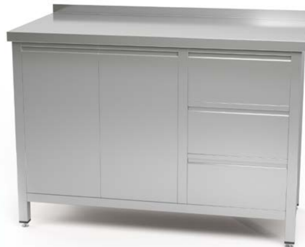
1 Stół przyścienny z szafkami z szufladami