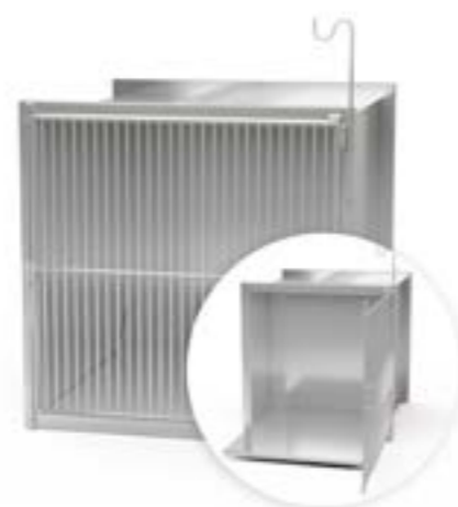
4 Klatka pojedyncza iniekcyjna