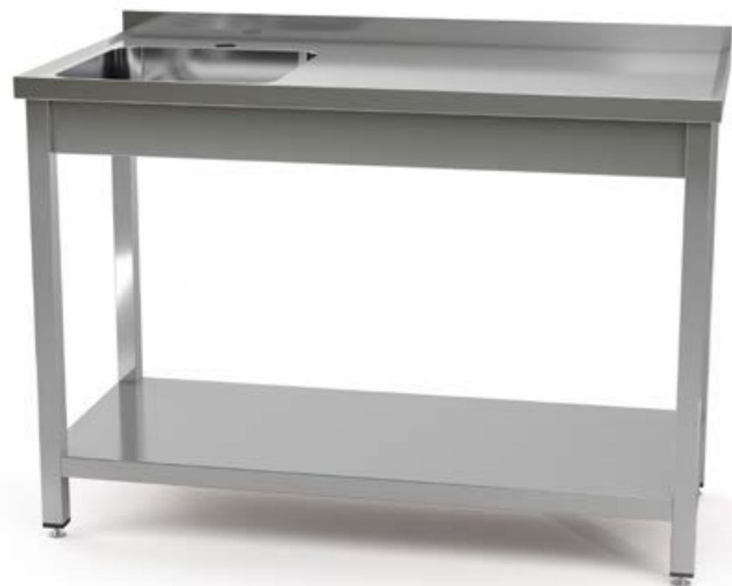
1 Stoły przyścienne ze zlewem i półką