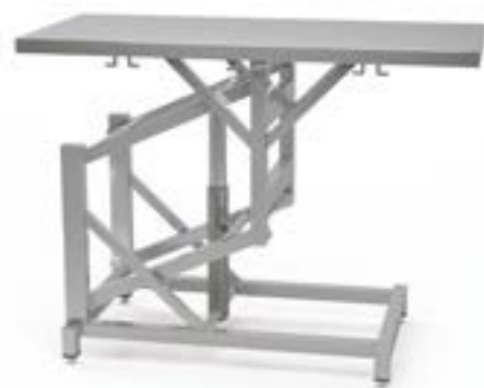
3 Stół z regulowaną wysokością elektryczny płaski