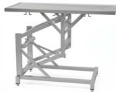
2 Stół z regulowaną wysokością ręczny profilowany