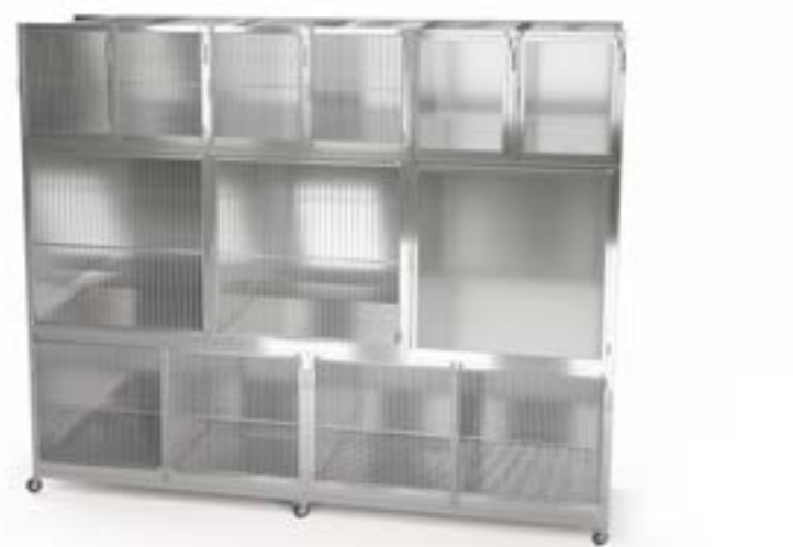
1 Podstawa jezdna