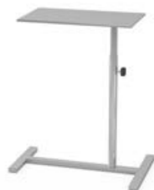
1 Stolik narzędziowy S bez kółek