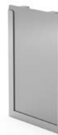
5 Tabliczka opisowa A5