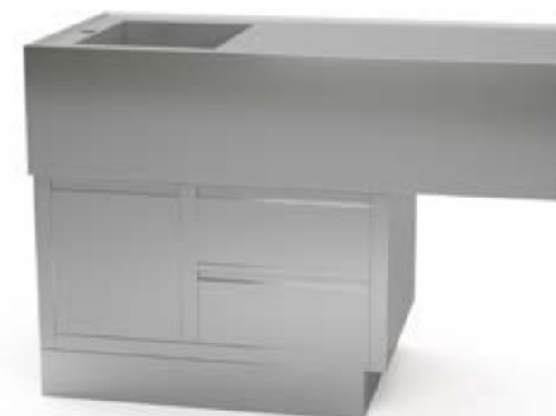
1 Stół ze zlewem centralny