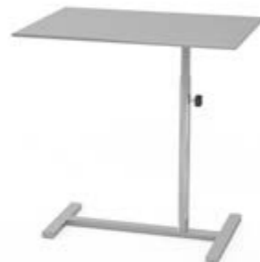
3 Stolik narzędziowy L bez kółek