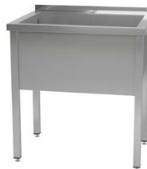
1 Wanna przyścienna otwarta