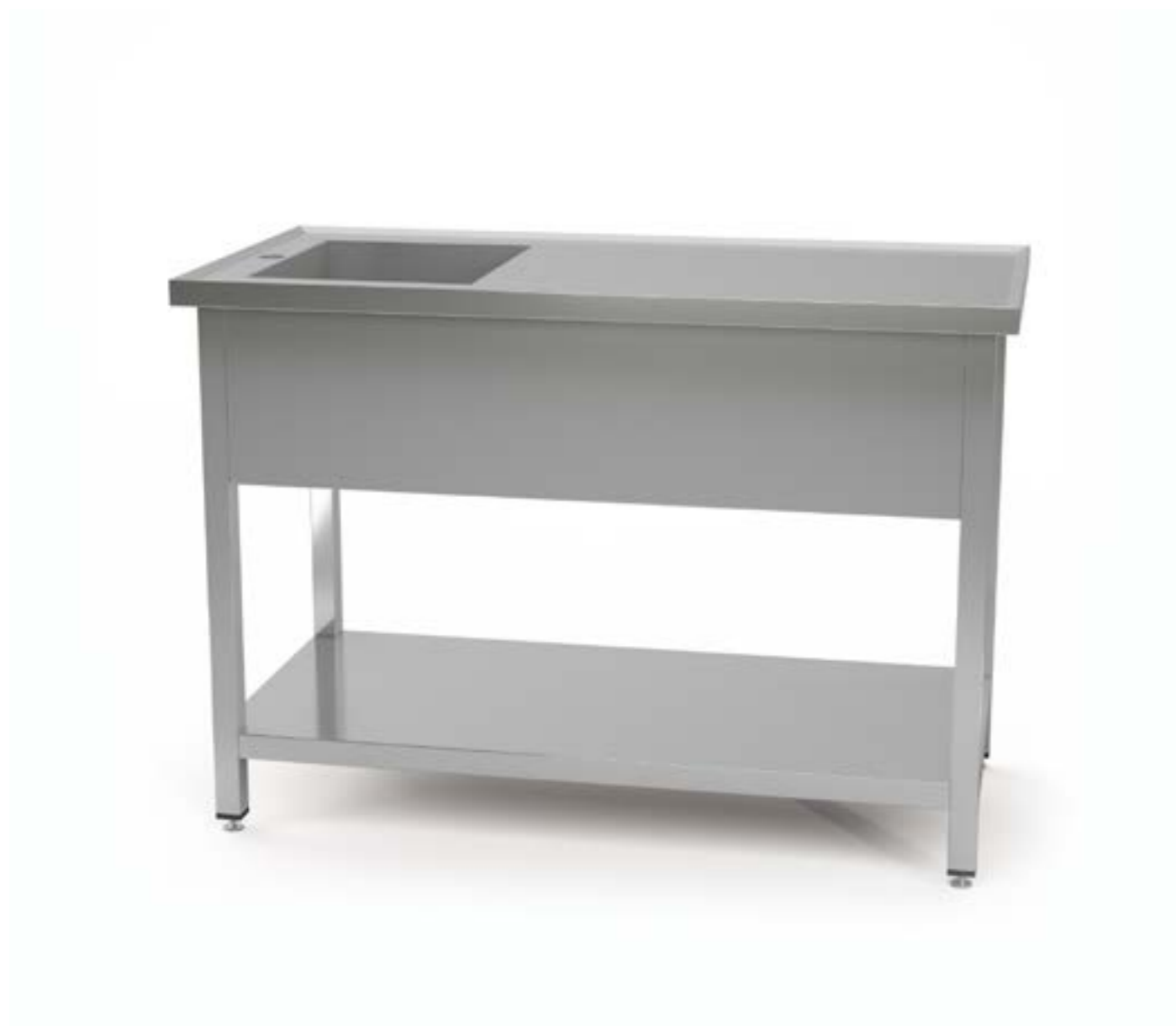
1 Stół ze zlewem centralny i półką