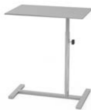
2 Stolik narzędziowy M bez kółek