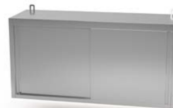
3 Szafka wisząca z drzwiami przesuwными