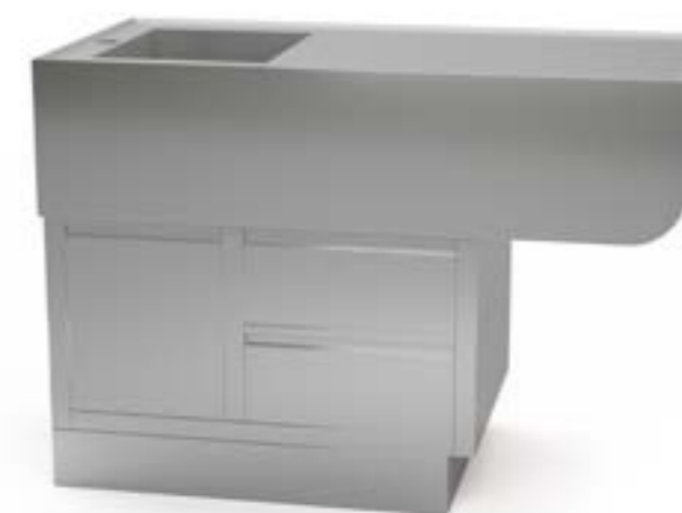
2 Stół ze zlewem centralny