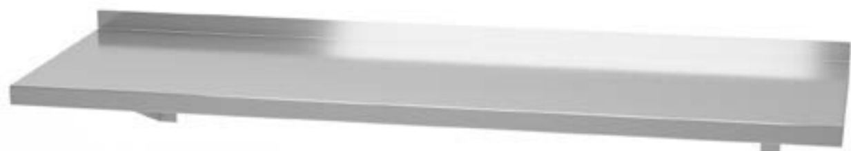
1 Półka wisząca