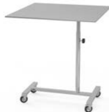
6 Stolik narzędziowy L z kółkami