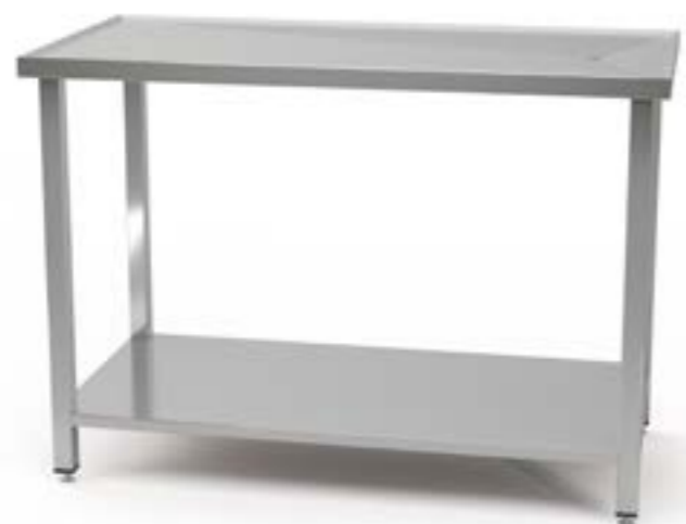
2 Stół centralny z półką z blatem profilowanym z odpływem