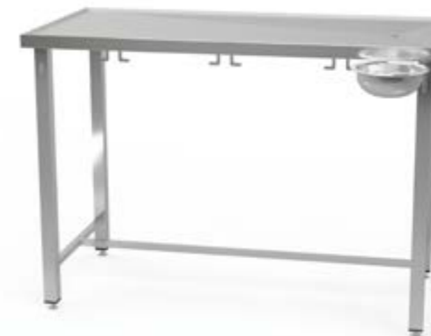
2 Stół centralny z uchwytami z blatem profilowanym z odpływem