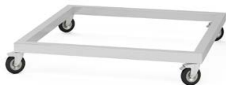
1 Podstawa jezdna