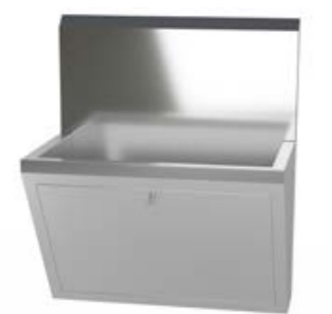
4 Umywalka chirurgiczna