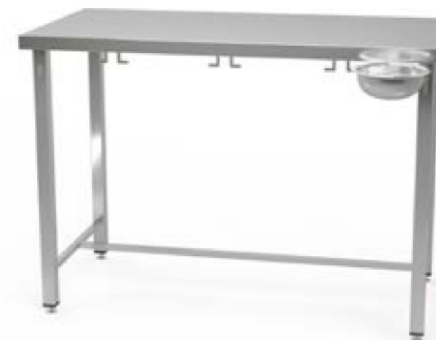
1 Stół centralny z uchwytami z blatem prostym