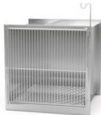
2 Klatka pojedyncza z kuwetą