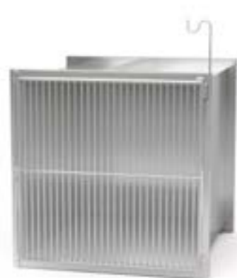
1 Klatka pojedyncza bez kuwety