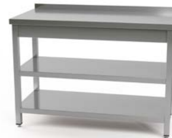
2 Stół przyścienny z 2 półkami