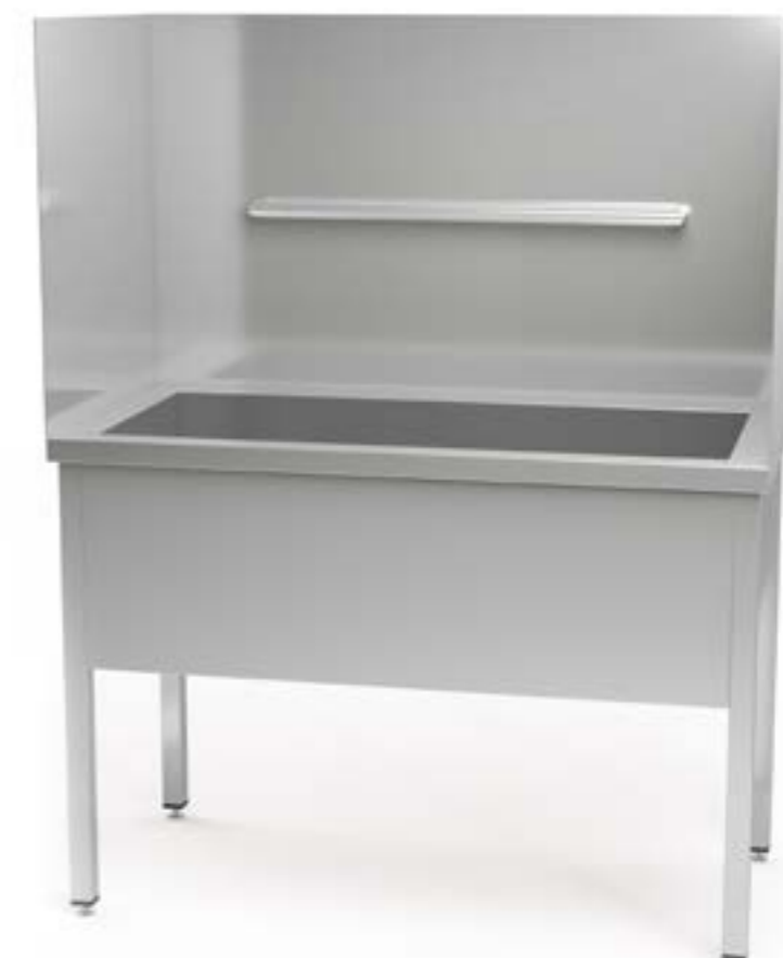
2 Wanna przyścienna z osłonami