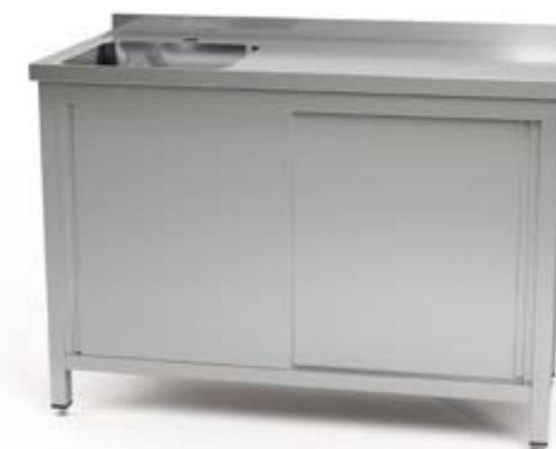
2 Stoły przyścienne ze zlewem i szafkami z drzwiami suwanymi