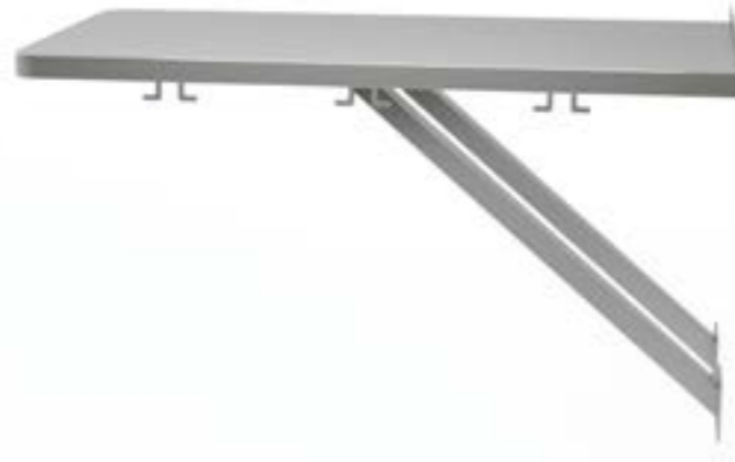
1 Stół montowany do ściany stały z blatem prostym