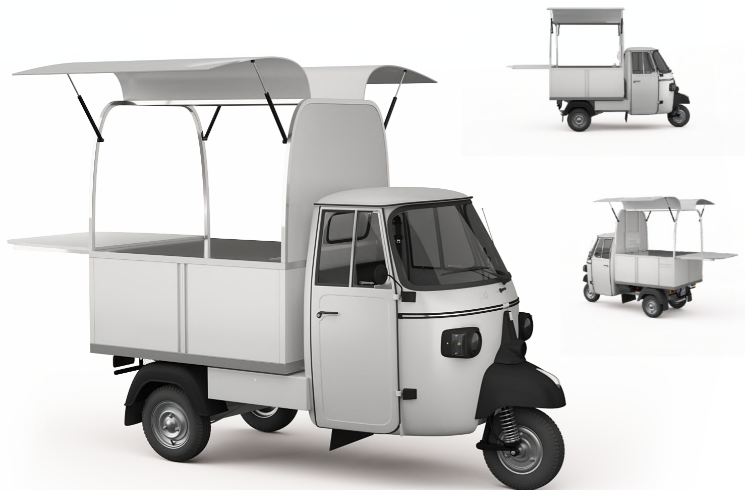
Wizualizacja jest poglądowa.