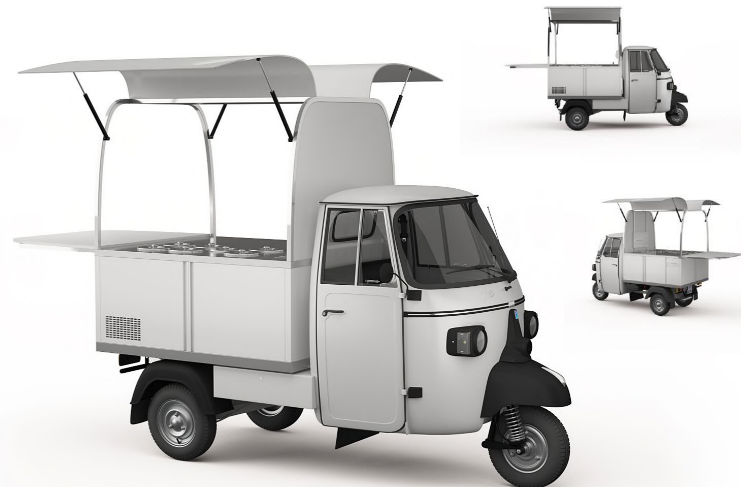
Wizualizacja jest poglądowa.