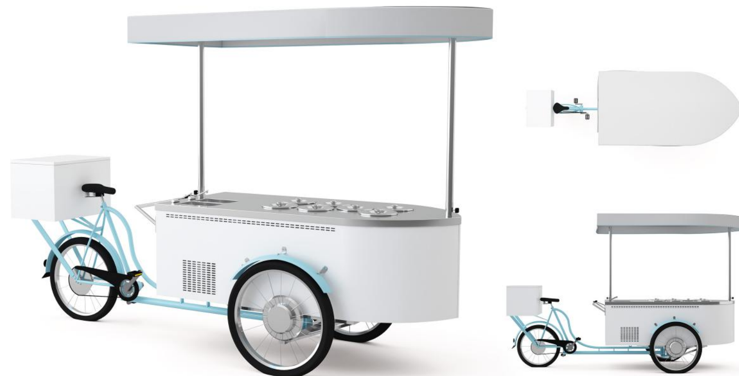
Wizualizacja poglądowa. Cena nie zawiera kuwet.

Pełna informacja na temat roweru do lodów w katalogu rowerów.