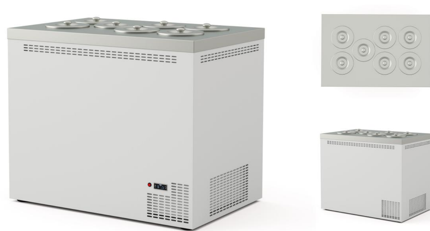
Wizualizacja pogładowa. Cena nie zawiera kuwet.