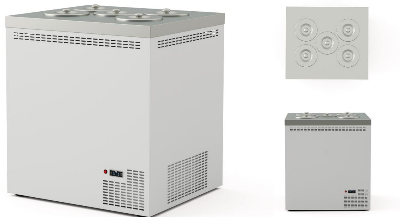
Wizualizacja pogładowa. Cena nie zawiera kuwet.