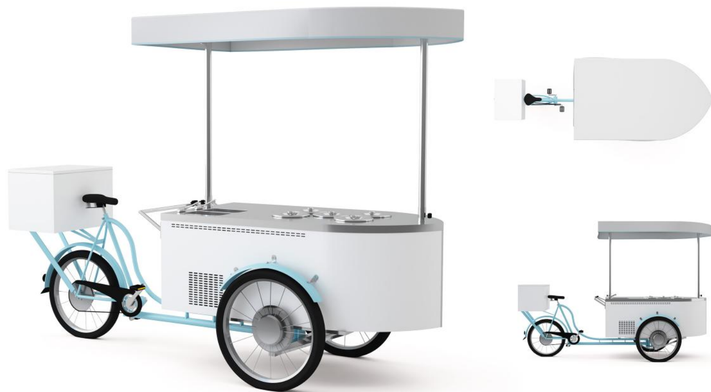
Wizualizacja poglądowa. Cena nie zawiera kuwet.