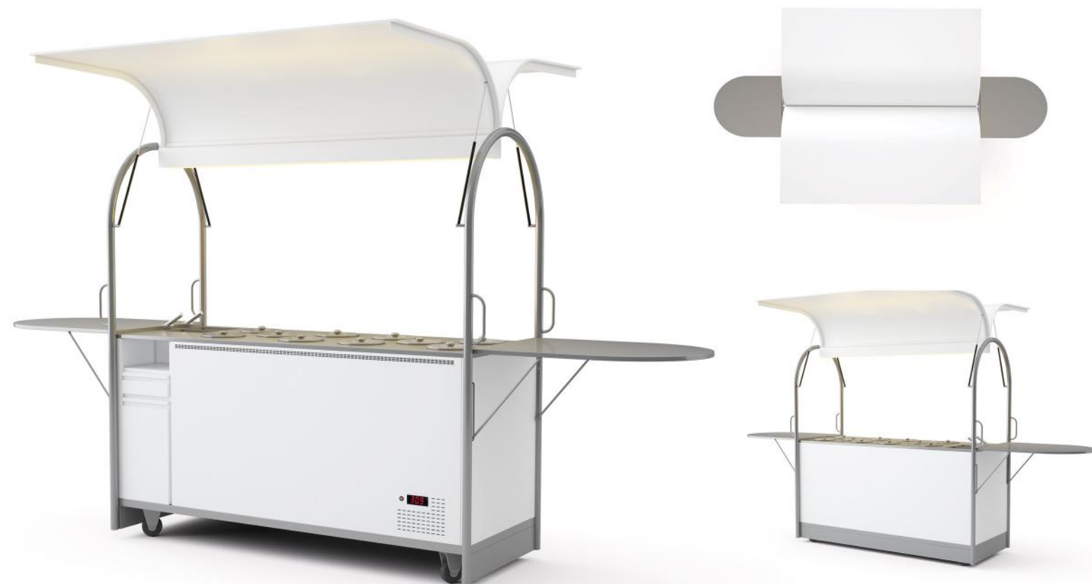
Wizualizacja pogładowa. Cena nie zawiera kuwet.