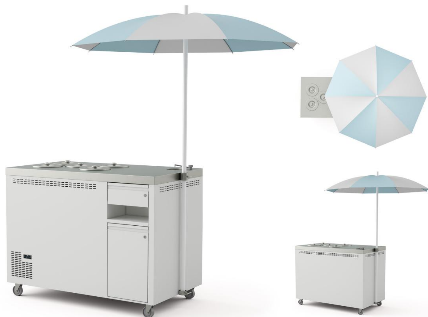
Wizualizacja poglądowa. Cena nie zawiera kuwet.