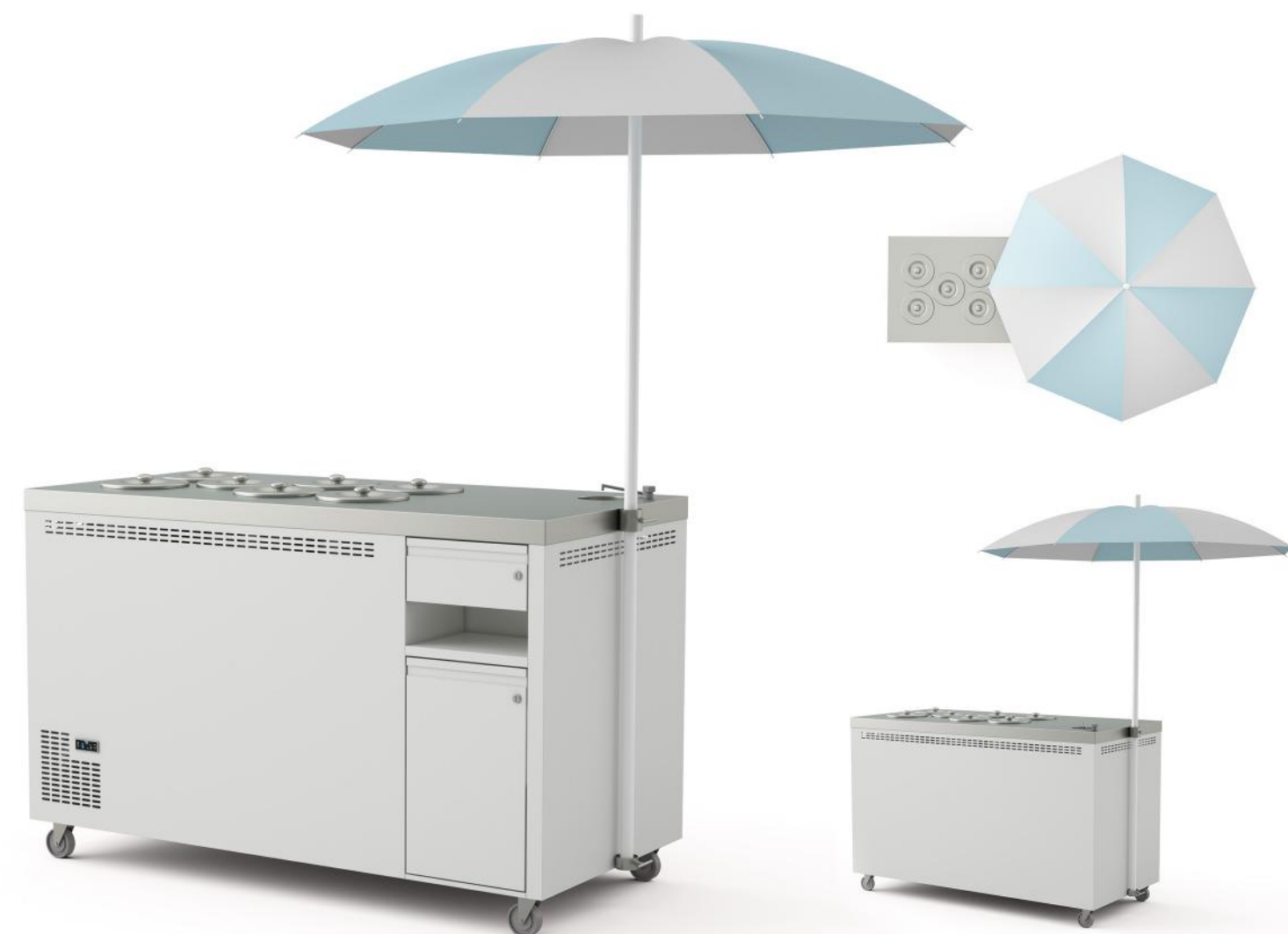
Wizualizacja poglądowa. Cena nie zawiera kuwet.