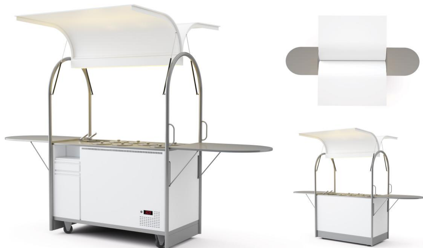
Wizualizacja pogładowa. Cena nie zawiera kuwet.