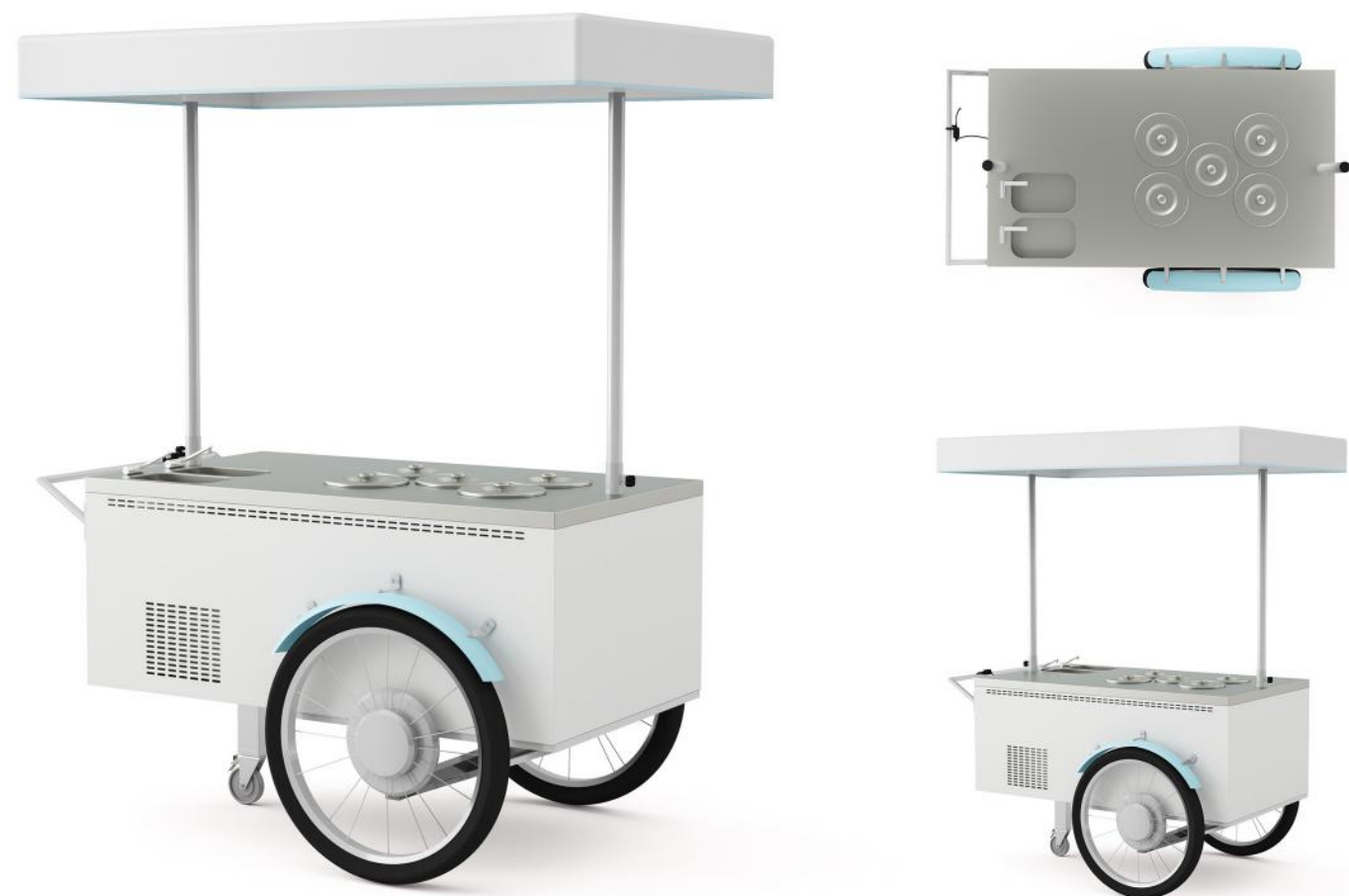
Wizualizacja poglądowa. Cena nie zawiera kuwet.