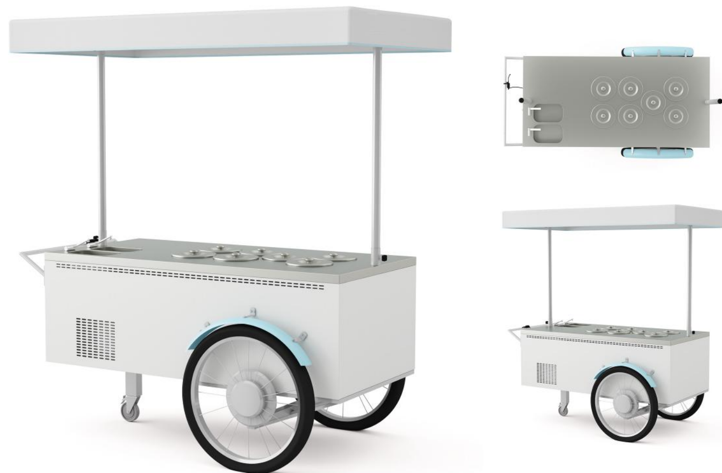
Wizualizacja poglądowa. Cena nie zawiera kuwet.