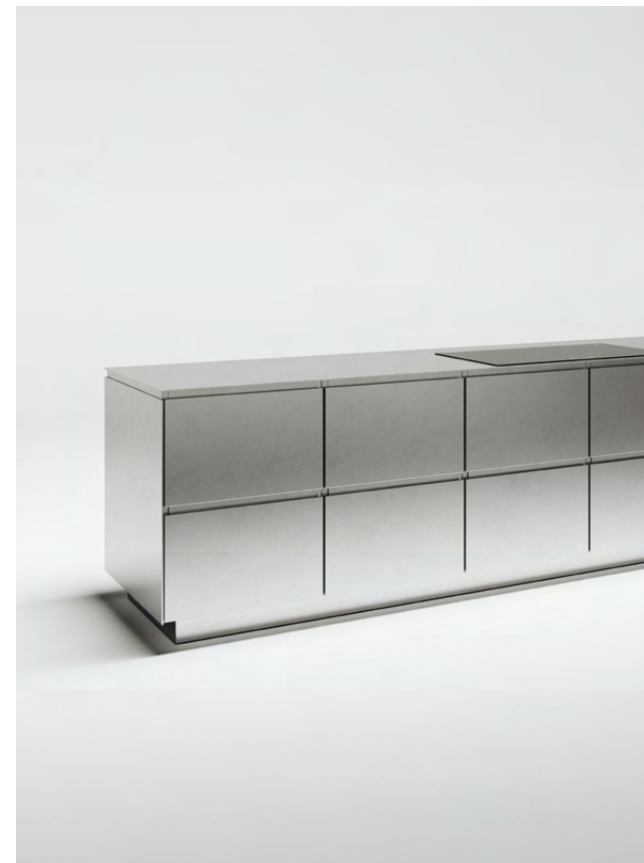
Korus nierdzewny Błat nierdzewny 5 mm Fronty nierdzewne, ze stali 3 mm