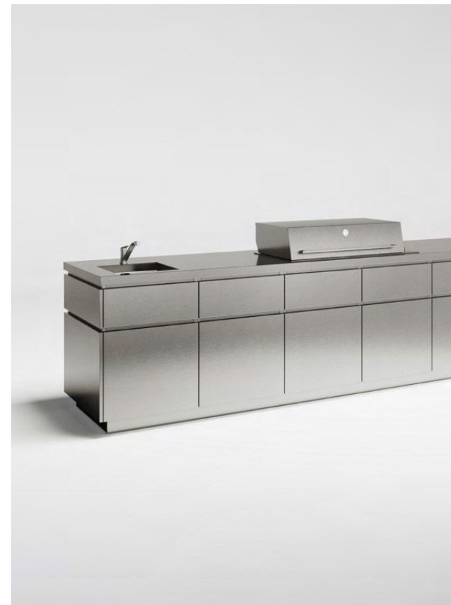
Korpus nierdzewny Błat nierdzewny 50 mm Fronty nierdzewne, zacinane na 45 stopni