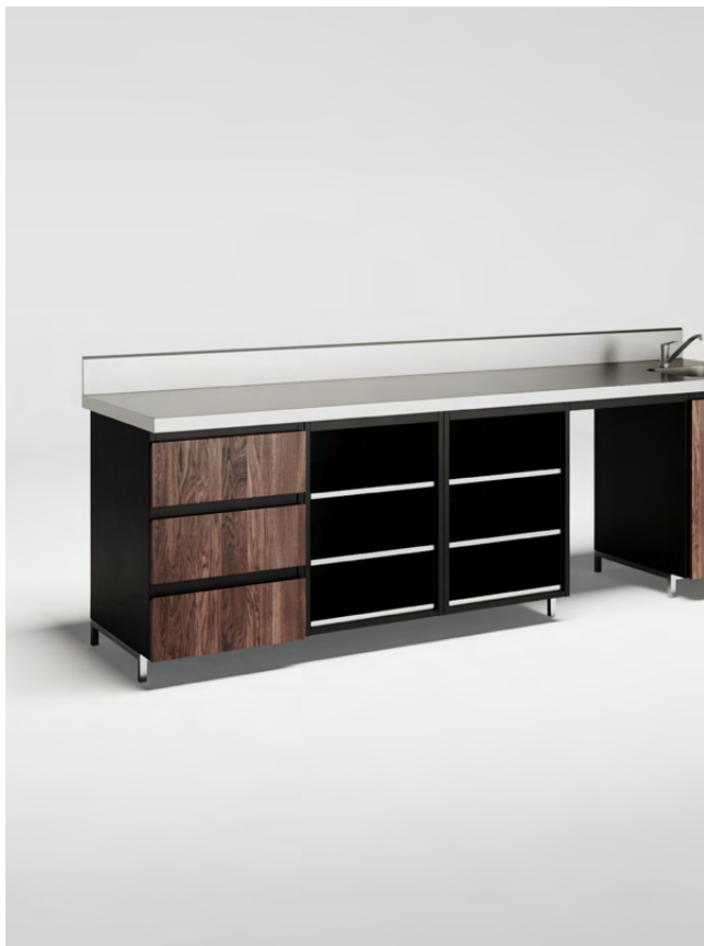
Korpus malowany proszkowo Błat nierdzewny 50 mm, z rantem Fronty i półki forniowane, zacinane na 45 stopni