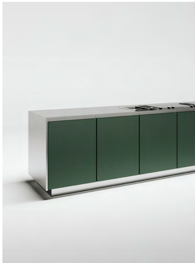
Korpus nierdzewny Błat nierdzewny 20 mm, opadający Fronty malowane proszkowo, zacinane na 45 stopni