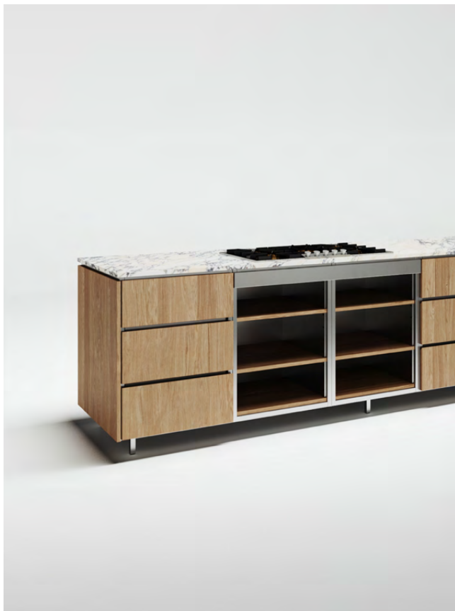
Korpus nierdzewny Błat kamienny Fronty i półki fornirowane, zacinane na 45 stopni