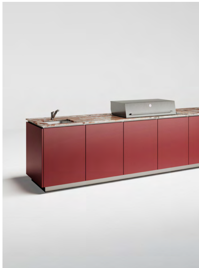
Korpus nierdzewny Błat kamienny Fronty malowane proszkowo, zacinane na 45 stopni